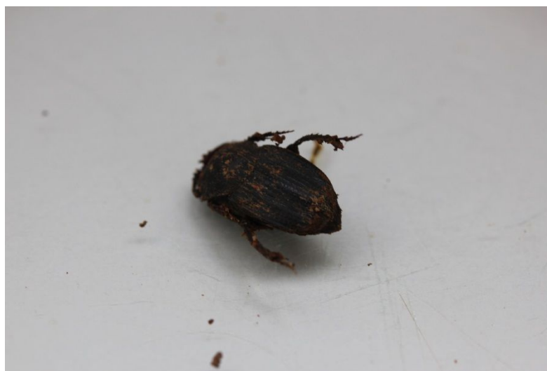
Figura 6. Eurysternus parallelus antes da marcação.

Eurysternus parallelus , com corpo alongado e coloração cinza-escuro (Figura 6), medindo pouco mais de 1 cm de comprimento, é um endocoprídeo, possuindo o hábito de enterrar-se nas fezes.