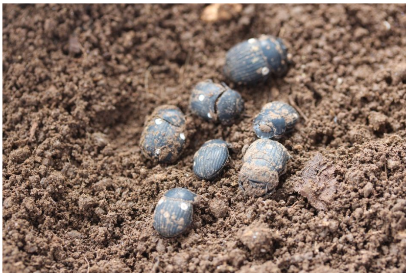
Figura 4. Indivíduos de Dichotomius aff. sericeus marcados com tinta branca nos élitros.

Dichotomius aff. sericeus : besouros de porte médio, 1,5 cm de comprimento, coloração preta opaca (Figura 4), pouco agitados, constroem túneis profundos (cerca de 20 a 25 cm de terra no pote) e grandes, local onde permanecem dentro. São pouco resistentes a alterações no meio, quando muitos indivíduos são mantidos no mesmo pote de criação a taxa de mortalidade aumenta.