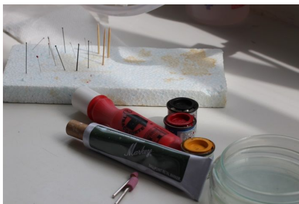
Figura 1. Tintas, lixas de rebolo e outros materiais usados nos experimentos de marcação de besouros escarabeíneos.

Os indivíduos receberam marcações de pontos nos élitros para identificá-los individualmente, com o método mostrado na Figura 2. Seguindo este método é possível marcar até 154 indivíduos com somente uma cor de tinta.