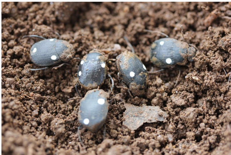
Figura 5. Indivíduos da espécie Deltochilum morbillosum , marcados com tinta branca, apresentando comportamento de tanatose.

Eurysternus parallelus , com corpo alongado e coloração cinza-escuro (Figura 6), medindo pouco mais de 1 cm de comprimento, é um endocoprídeo, possuindo o hábito de enterrar-se nas fezes.