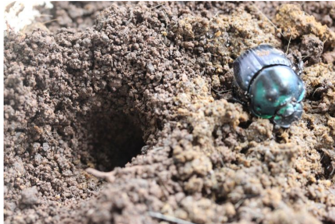
Figura 3. Fêmea de Coprophanaeus saphirinus mantida em cativeiro no Laboratório de Ecologia Terrestre Animal, ao lado da entrada do túnel.

Phanaeus splendidulus : são besouros de tamanho grande, também em torno de 2 cm de comprimento, com coloração esverdeada, pouco ativos, com comportamento calmo nos momentos de contagem e marcação, cavam túneis nos quais enterram o alimento, normalmente machos e fêmeas compartilham o mesmo túnel, em alguns momentos permanecem na região mais superficial da terra.